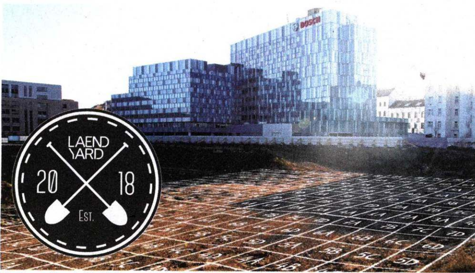
Die Baugrube wird in kleine Buddelbereiche unterteilt, in jedem ist ein Schatz vergraben